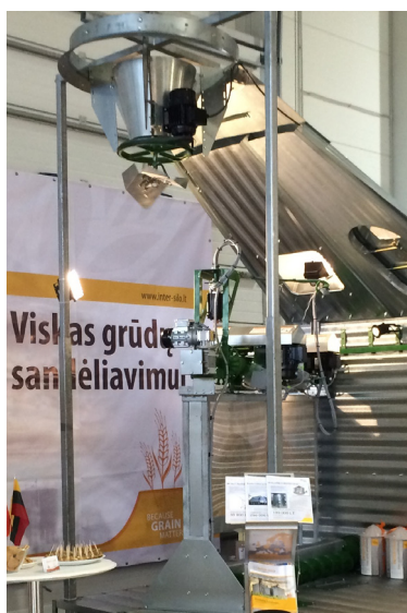
Eksponas – sumažinta grūdų bokšto su džiovavimo įranga kopija

Gerai orai ne tik paskubina anksčiau pradėti pavasario darbus, bet ir pritraukė daugiau dalyvių į ūkininkams skirtas pavasarinės parodas. Įmonė „Inter-Silo“ parodoje „Ką pasėsi...“ pristatė unikalų ekspонатą, vaizduojantį Lietuvoje dar naują produktą – grūdų sandėliavimo bokštą su džiovavimo įranga.