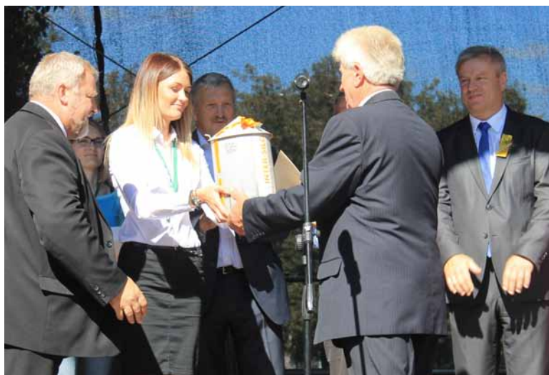
„Inter-Silo“ šventėje „Derlius 2014“.

2014-ųjų derliaus sezonas grūdų bokštų montavimo kompanijai „Inter-Silo“ buvo itin sėkmingas. Šiemet 13 kompanijos komandų sumontavo 105 įvairių dydžių grūdų sandėliavimo bokštus, kurių bendra talpa – apie 123 000 tonų.