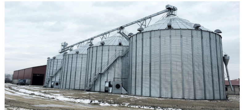
Jurbarko r. UAB „Agra Corporation“ įsigijo net keturis bokštus grūdams džiovininti.