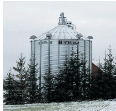
E. Jurgevičiaus 416 t grūdų džiovinimo bokštas.